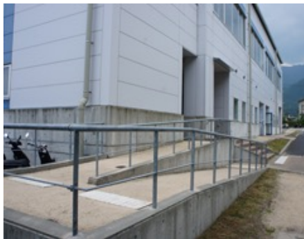
第2 講義棟前スロープ